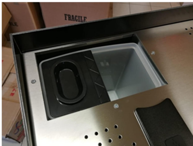
Réservoir 5 litres accessible par le haut