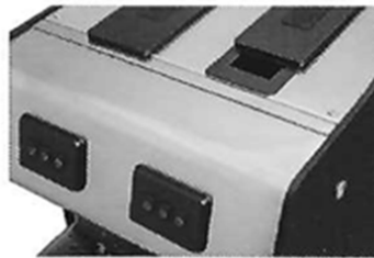
Mise en place des capsules par le haut de la machine (trappe d'ouverture)