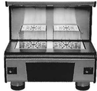
2 hauteurs de tasse possible avec système de strapontins amovibles