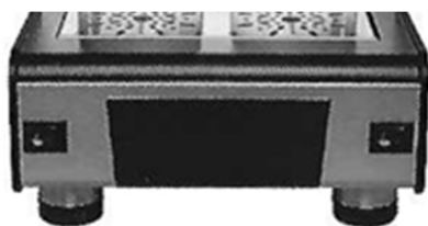
Boutons sur la partie frontale pour couper individuellement la chauffe des échangeurs thermiques (groupe café)