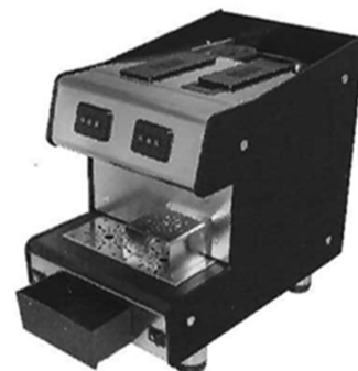
Bacs de récupération des capsules sur la partie frontale sous le bassin